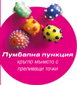
Лумбална пункция кръгло мънисто с преливащи точки