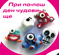
При по-лош ден чудовище