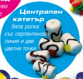
Централен катетър бяла ролка със серпентинова линия и две цветни точки