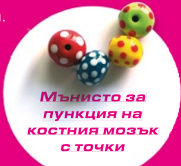
Мънисто за пункция на костния мозък с точки