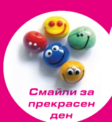
Смайли за прекрасен ден