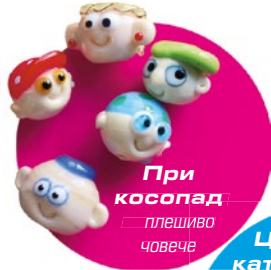
При косопад плешиво човече