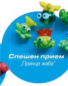
Спешен прием „Принца жаба“