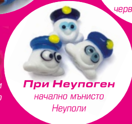
При Неупоген начално мънисто Неуполи