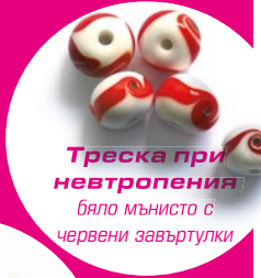
Треска при невтропения бяло мънисто с червени завъртулки