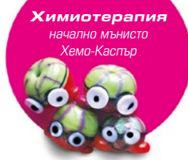
Химиотерапия начално мънисто Хемо-Кастър