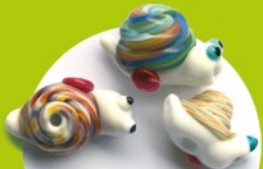
Startperlen Anker und Schneggli