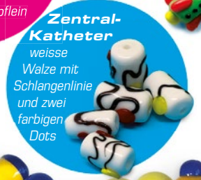
Zentral-Katheter weisse Walze mit Schlangenlinie und zwei farbigen Dots