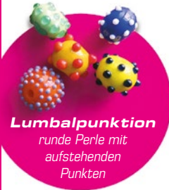
Lumbalpunktion runde Perle mit aufstehenden Punkten