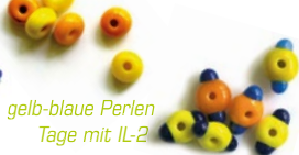
gelb-blaue Perlen Tage mit IL-2