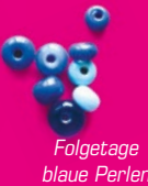
Folgetage blaue Perlen

Die meisten Patienten verwahren ihre Kette auch nach Abschluss der Behandlung wie einen Schatz oder dekorieren damit ihr Zimmer.