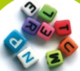
Name des Kindes Buchstabenperlen