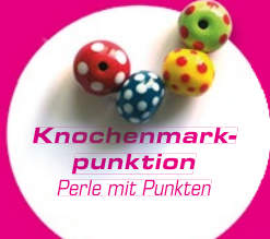
Knochenmarkpunktion Perle mit Punkten