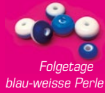
Folgetage blau-weiße Perle