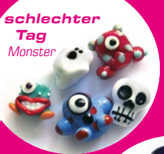
schlechter Tag Monster