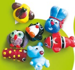
Port anstechen Tierchenperle