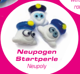
Neupogen Startperle Neupoly