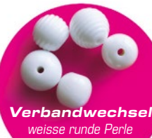
Verbandwechsel weisse runde Perle