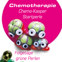
Chemotherapie Chemo-Kasper Startperle