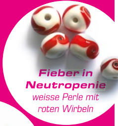
Fieber in Neutropenie weisse Perle mit roten Wirbeln